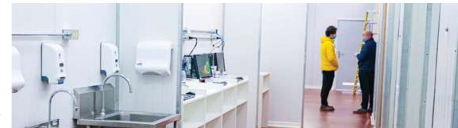
Módulo Zona 0 donado por Facultad de Arquitectura y Urbanismo.